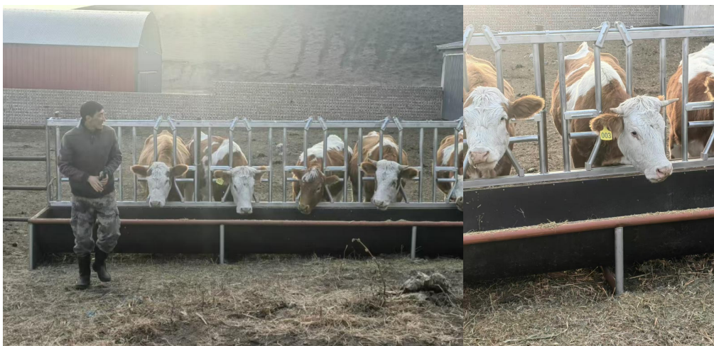
图：浩特乌素前期讨论会、勘测和分组