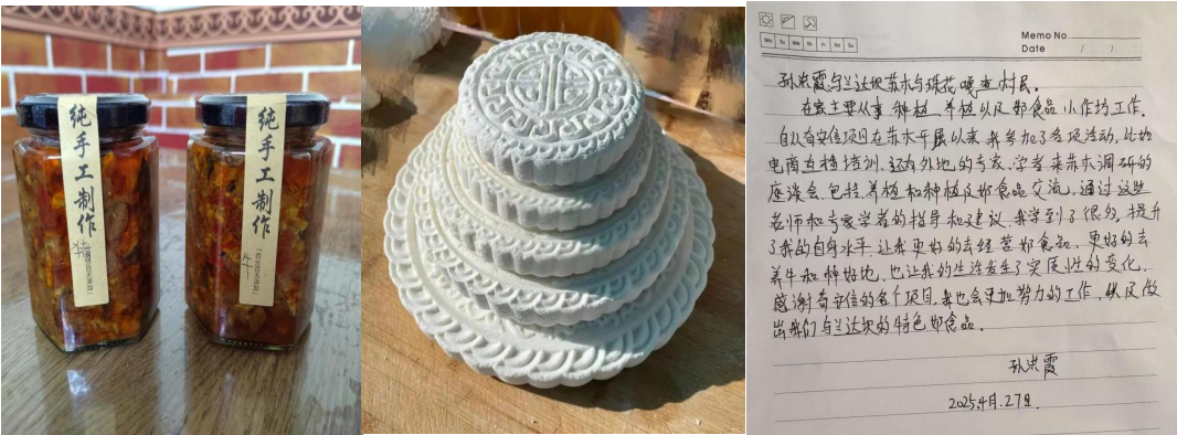
图：产业支持牧民产业发展和感谢信

产业基金的设置一是为了激活当地中青年创新创业的热情，培养后备的人才队伍，二是为了在主导产业低迷和生态保护的压力下，鼓励苏木结合实际条件积极探索多业态的发展。经过多轮调研，农禾之家协同苏木党委政府共同制定了产业基金的管理办法和2024年度实施办法，确保能够利用少量的资金发挥出更有效的作用。2024年度根据苏木实际情况主要针对肉牛养殖、地域特色小食作坊、蚯蚓养殖及粪肥利用、庭院经济和民宿发展等在内的5类14户进行帮扶支持，同时投入2万元采用孵化的方式培育牧家乐一个。通过产业基金能支持更多农牧民开展创新、创业，汇聚多元力量发展地方产业。