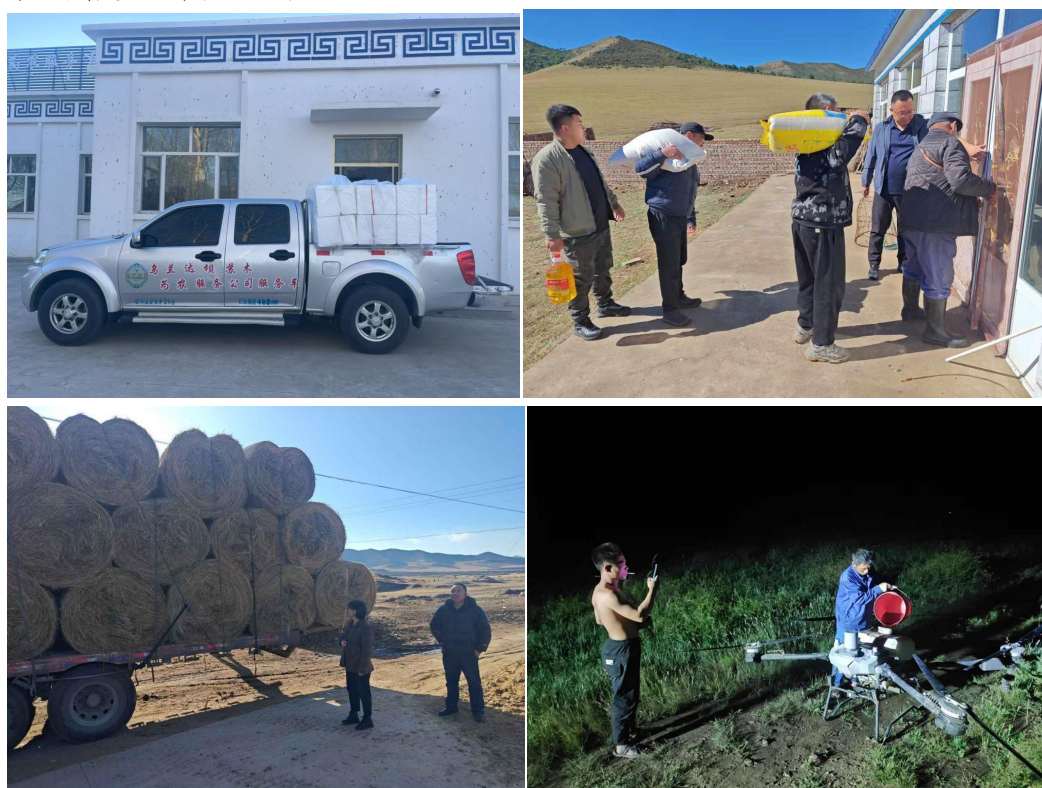
图：为农服务公司开展各种社会化服务

“喷多促”飞防服务 1.9 万亩；集采化肥 223 吨、种子 13.3 吨、米面粮油 24 余吨、优质牧草 890 余吨；帮助农牧民销售肉牛、奶食品、辣酱等农副产品，总计帮助农牧民增收、节支超过 87 万元。